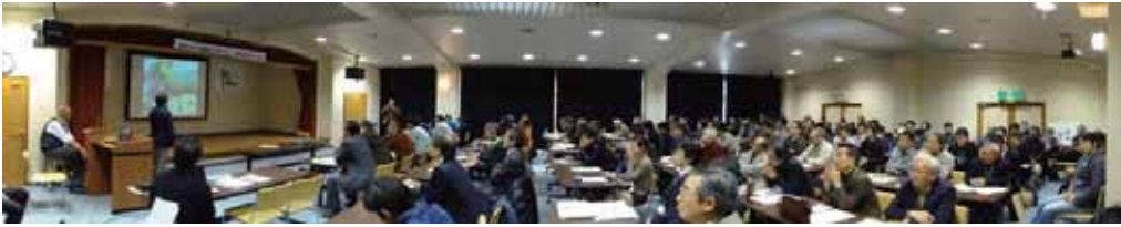
百業ネットワーク設立総会 (高知県仁淀川町 平成23年2月19日)

農山村の問題は同時に都市の問題です。人々が生存の基盤を何処に求め、私たちそれぞれのいのちが何処に繋がっているかを確認し、お互いの価値を認識し、農山村と都市が支えあい、人々が信頼しあえる新たな社会を築きます。その中から生まれる数々のライフスタイルや仕組み、価値観こそが、これからの100年、この国の進むべき方向の指針となり得るものと確信します。私たちは実践活動を行いながら、賛同者の輪を広げていきます。