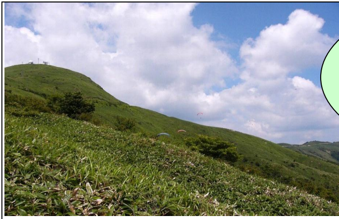
中津明神山 (画面左手が頂上)