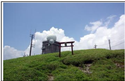
山頂の雨量観測所 (レーダードーム)

中津のシンボル明神山は標高1,541m。四国百名山に選定されており、仁淀川を挟んで大川嶺と対峙しており、膨大な山容を呈しています。頂上周辺にはツツジとブナがある。山頂には祠があり、また雨量観測所があり、大型のレーダードームも設置されている。