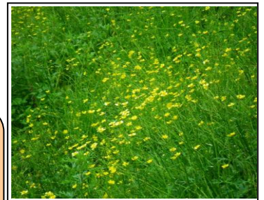
カラ池に咲くキンポウゲ

標高1,220mで数ヶ所に湿原がある。湿原の周囲には樹木、草花の種類が多く、特に春のツツジ、アセビ、初夏のキンポウゲ、秋のカエデ、ブナ等の紅葉はカラ池特有の